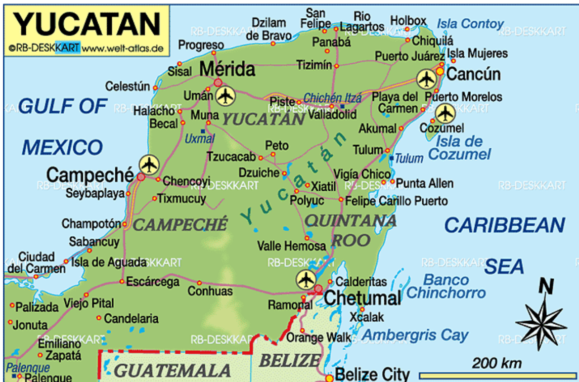
Karta över Yucatan. Vi fiskade vid Punta Allen och på Cozumel

Det andra alternativet som vi själva funnit på nätet var "flatsen" och lagunerna på norra Cozumel som är en ö ca 35 minuters resa med färja från Playa del Carmen så detta skulle självklart också utforskas.