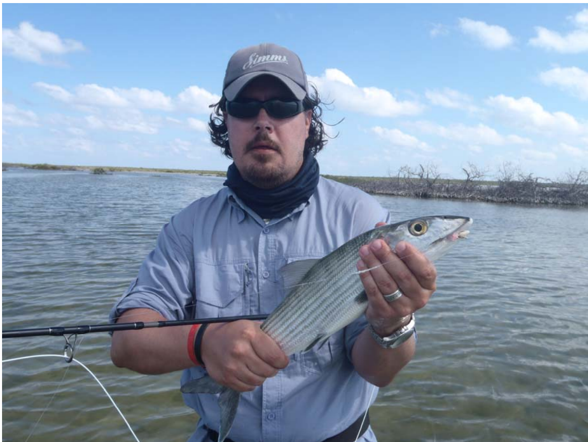
"The grey ghost of the flats" (fisken alltså....)