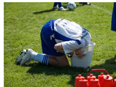
– Jag tänker.