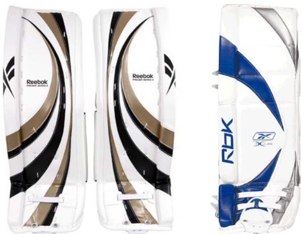
Reebok med 2 flex i knädel

Just i den situationen behövs bra skydd vid fingrarna mot pucken och vassa skridskor som kan finnas i din närhet. Undvik att plattan böjer sig för mycket. Den täcker då betydligt mindre än om du kan hålla den rak och någorlunda i plan. De nya reglerna begränsar längden på plattan till ca 38 cm och bredden till ca 20 cm. Observera att kantbandet räknas in vid en mätning. Tänk på att din klubbhandske ska ha rejält med skydd för tumme och handled.