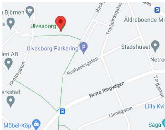
Ulvesborg idrottsplats, Tidaholm