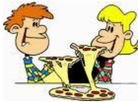
trollade fram pizzor till dem som ville omklädningsrummet efteråt.

Sen fördelades 30 personer i bilar för en färd till Mölndalsvägen i Göteborg och efterlängtat: