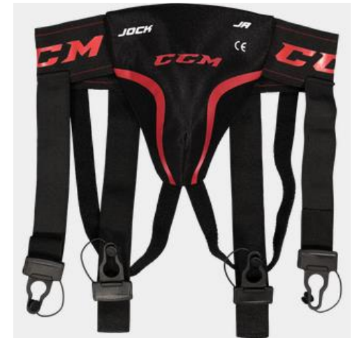
En combo kostar ca 239kr