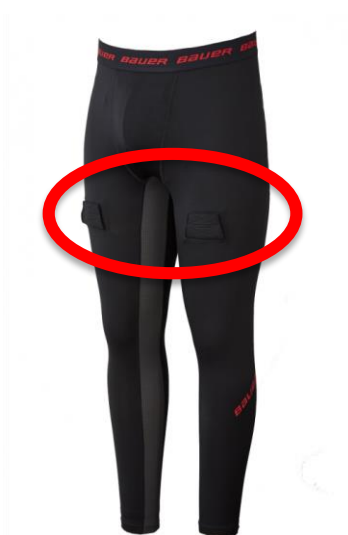
En del av understället 499kr

Vi ser att flera av våra spelare saknar så kallade damaskhållare. Vi rekommenderar att man köper till damaskhållare.