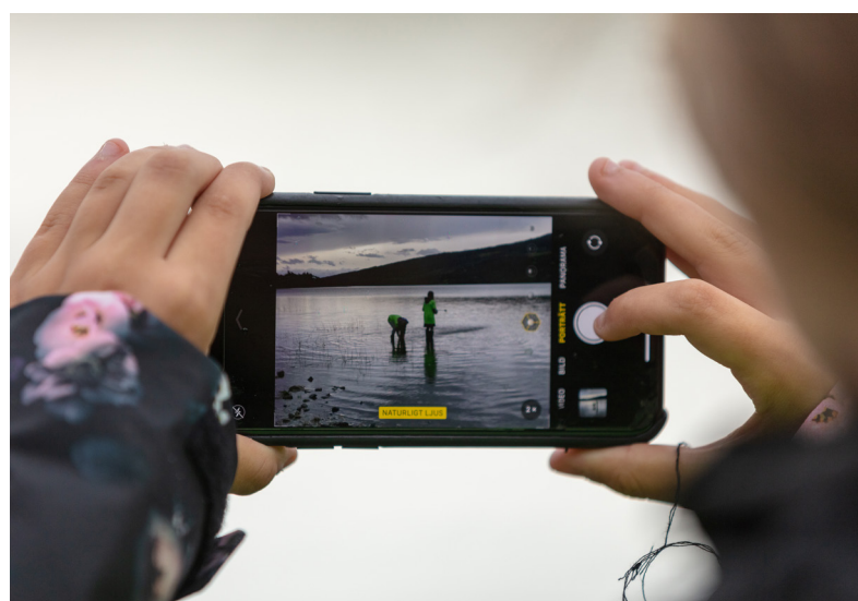
Foto & filmer

Alternativt gå in på www.stadasverige.se och klicka på "För föreningar", där finns både Rapportkort och Skräpanalys.