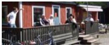
En härlig sommardag och mycket publik på matchen

Dags för vår andra och även sista hemmamatch i Allsvenskan ute 2007 i Div 3B mellansvenska. Kanonväder, som vanligt fina banor hemma hos oss, så bra förutsättningar för bra tennis! För motståndet stod Gävle TK som vunnit sina tidigare matcher, så vi visste innan, att här skulle vi få det "hett" om öronen!