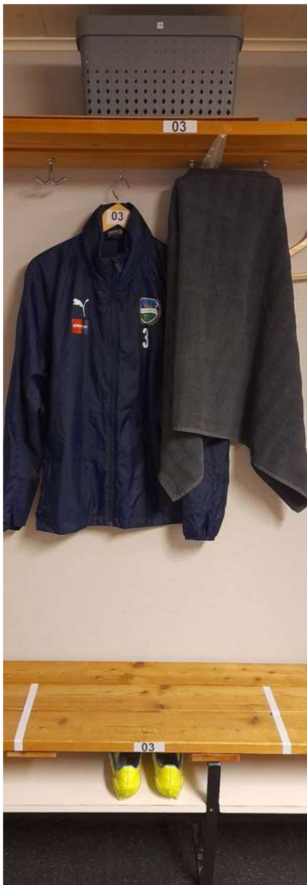
Exempel för spelare som innehar Plats 03 ovan

2) Hänga upp handduk och vindjacka på krokar på sin plats (för torkning under natten)