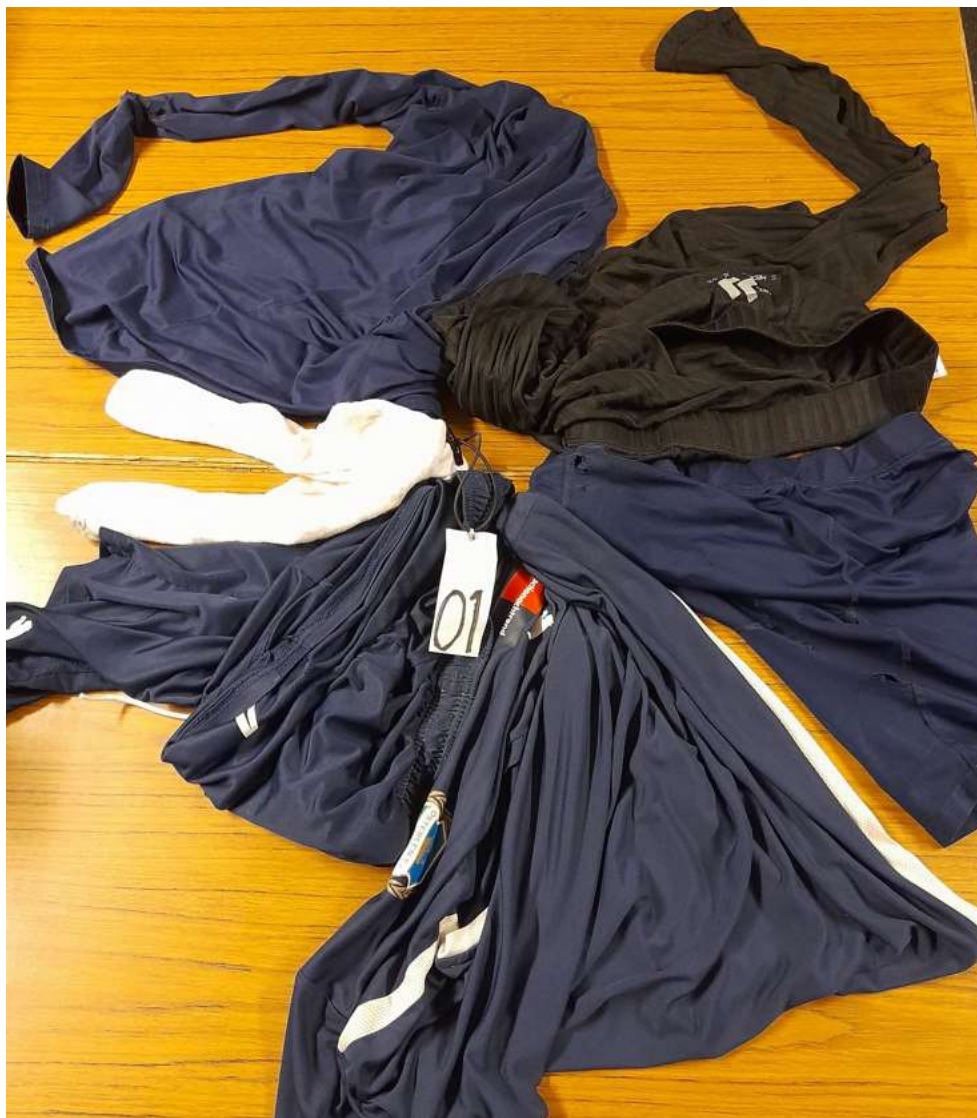
Exempel för spelare som innehar Platsnummer 01 ovan

Endast ovan kläder ryms i tvättbandet. Inget annat. Det blir inte torrt annars.