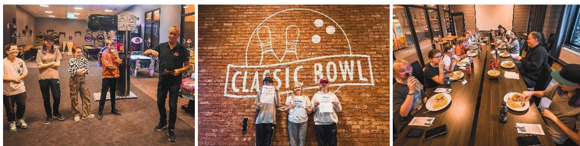
3-kamp med hamburgare på Classic Bowl/Strike & c:o

Klubben arrangerade säsongavslutning med 3-kamp och hamburgare för U13/juniorlaget.