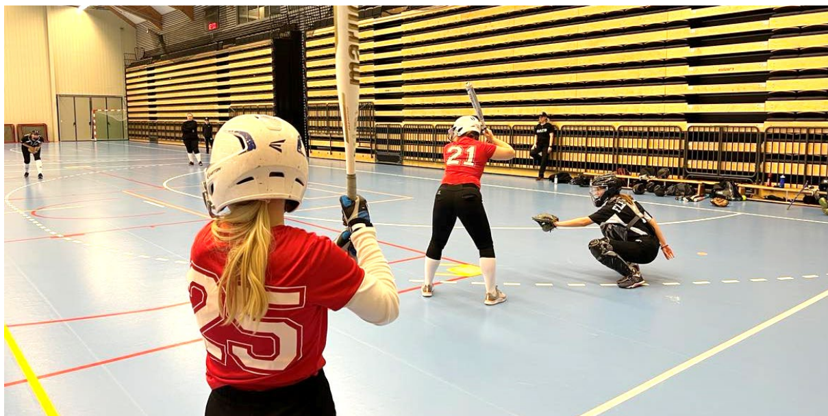
Träningsmatch mot Karlskoga i Idrottshuset.

Under året har klubben spelat flera träningsmatcher både med senior/junior samt med U13, främst mot Karlskoga.