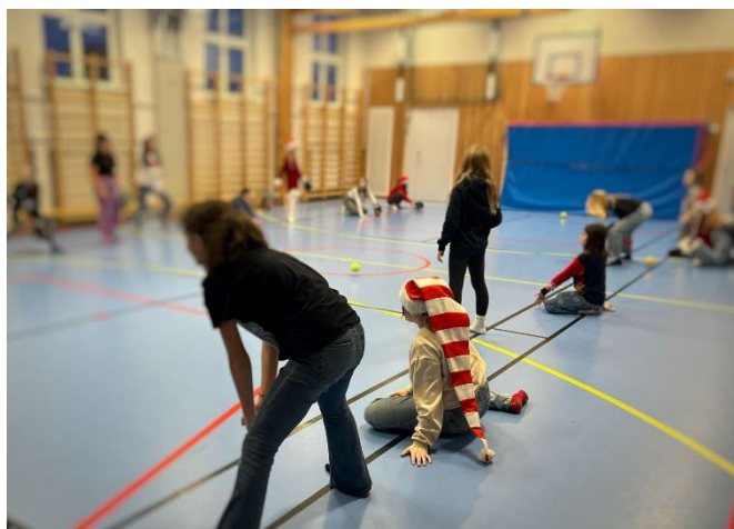
Prova-på under Rostafesten och skolbesök.