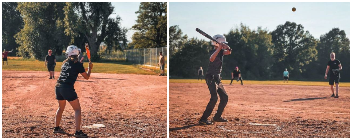
Slowpitchmatcher i Åbyparken

Klubben har arrangerat flera slowpitchmatcher under sommaren som varit öppna för alla som vill delta.