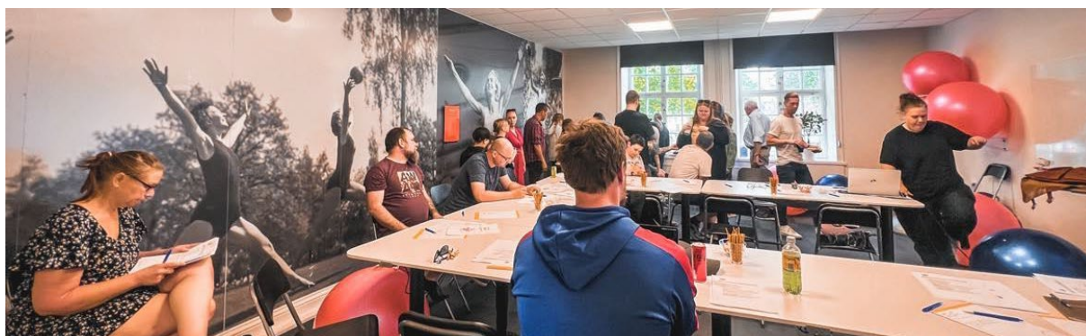
Årsmöte på idrottens hus.

Årsmötet hölls på idrottens hus med stor uppslutning av klubbens medlemmar.