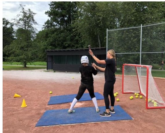
Träningsmatch i Ballonghallen i Vivalla, och softbollträning i Åbyparken.