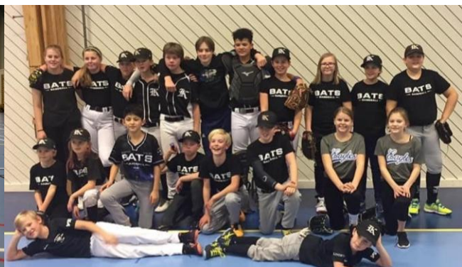
Träningsmatch mellan Eagles och Bats