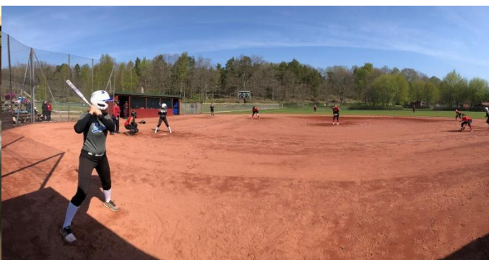
Sharp Slide Tournament. Teambuilding och match