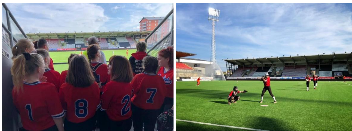
Uppvisning i matchpaus på Behrn Arena.

I samband med en av KIF Örebro Damfotbolls matcher visades sporten upp i pausen och klubben ställde upp en slagunnel i Behrn Arena.