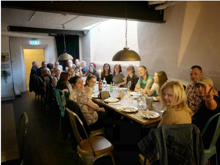
Medlemsmöte på Ölcaféet