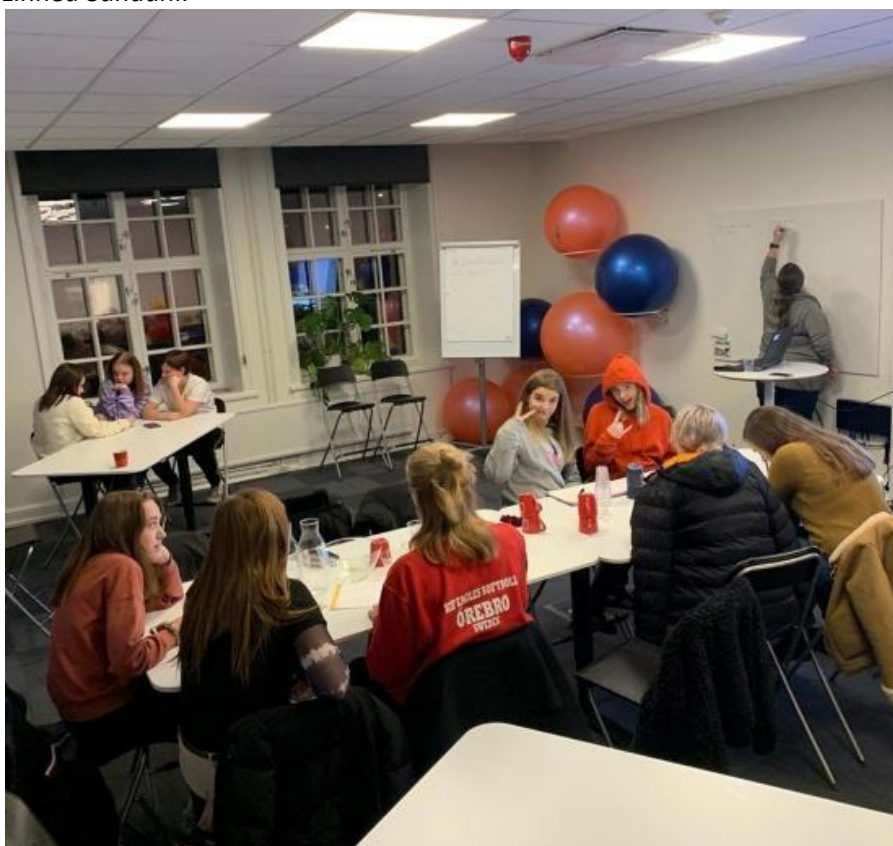
Kick off med softbollaget