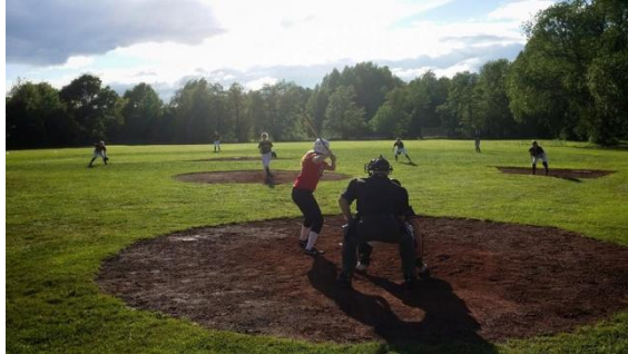
Träningsmatcher mot Enköping och Akademin

Föreningens U12-lag har spelat två träningsmatcher under året mot Karlskoga och Skövde.