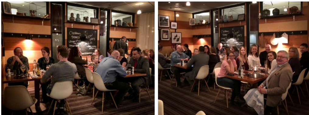
Glamiddag på Clarion