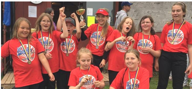
U12-laget på Billingslaget

Klubbens U12-spelare deltog i Billingslagt i Skövde där de spelade två softbollmatcher mot de andra lagen.