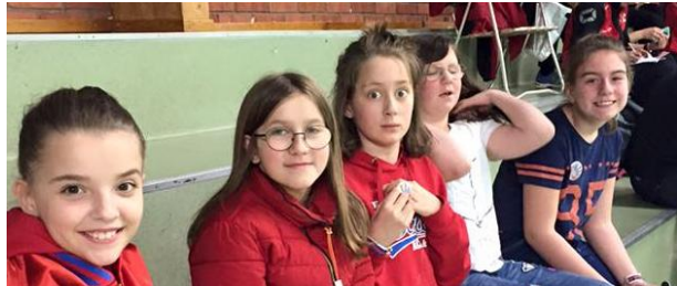
Laget och U12-supporters