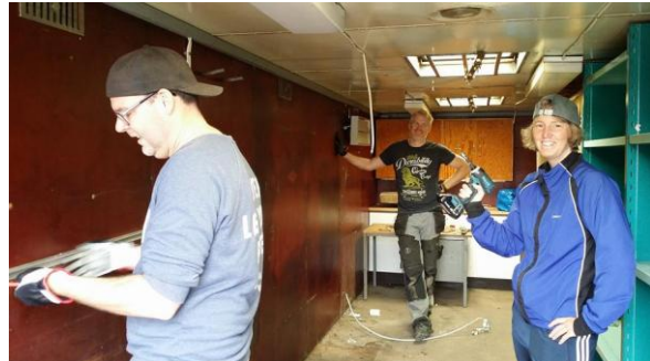
Plandag med slowpitch och grillning