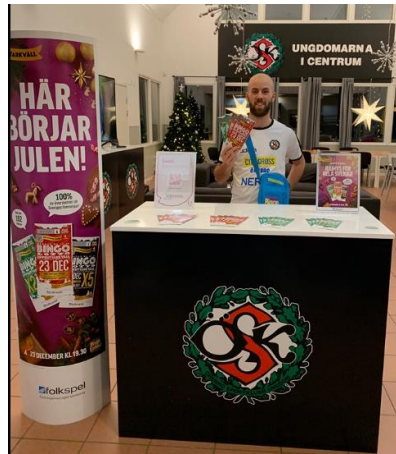
Se önskad placering av disk och material vid försäljning.

Vid frågor rörande förrådet, försäljningsplatsen saker rörande gallerian, vardagar kontakta centrumledningen 019-20 67 90, helger kontakta ordningsvakterna på 076-854 57 70. Saker rörande försäljningen kontakta respektive verksamhetsutvecklare.