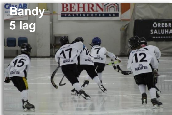
Bandy 5 lag