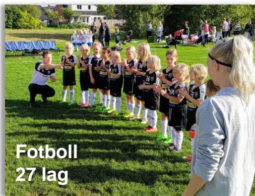
Fotboll 27 lag