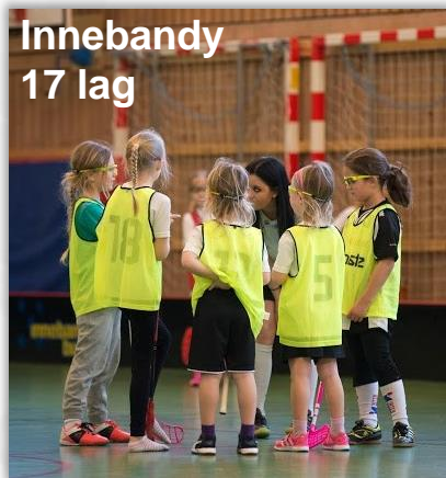
Innebandy 17 lag