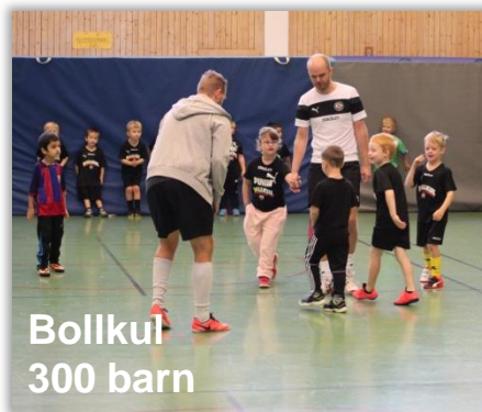
Bollkul 300 barn