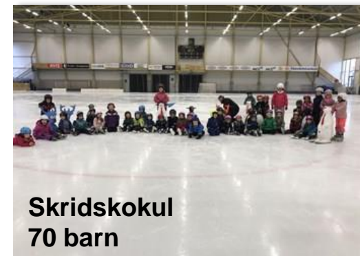
Skridskokul 70 barn

UNGDOMARNA I CENTRUM! BANDY - INNEBANDY - HANDBOLL - FOTBOLL