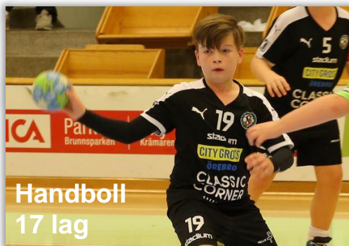
Handboll 17 lag