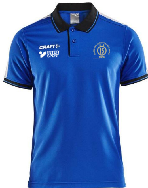
Piké pro control impact JR 359:- * SR 409:- *