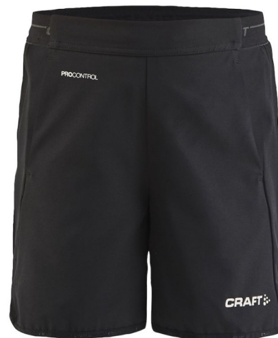
Shorts pro control impact JR 289:- (122/128, 134/140, 146/152, 158/164) SR 329:-

Storlekar Junior: 122/128, 134/140, 146/152, 158/164