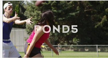
Bild på flaggfotbollspelare som tar emot boll.