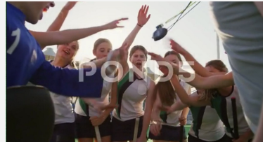
Bild på landhockeylag som peppar inför match

Bild på två landhockeylag som möts och skakar hand