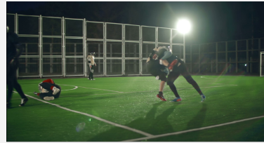
Bild på amerikansk fotbollsspelare som springer med boll och blir tacklad.

Bild på amerikansk fotbollspelare som springer och hoppar över motståndare med boll