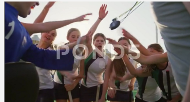
Bild på landhockelag som peppar inför match