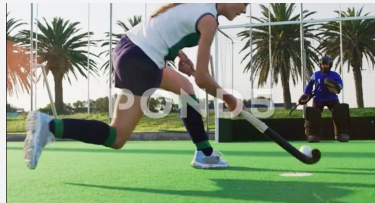
Bild landhockeyspelare som gör mål.

Bild på två två landhockeyspelare som springer med boll