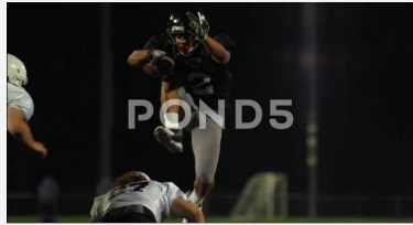
Bild på amerikansk fotbollspelare som springer och hoppar över motståndare med boll