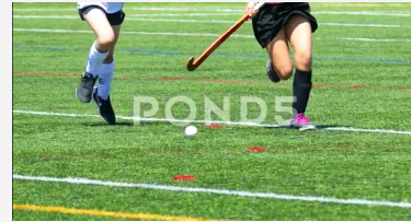
Bild på två två landhockeyspelare som springer med boll

Bild på flaggfotbollspelare som tar emot boll.