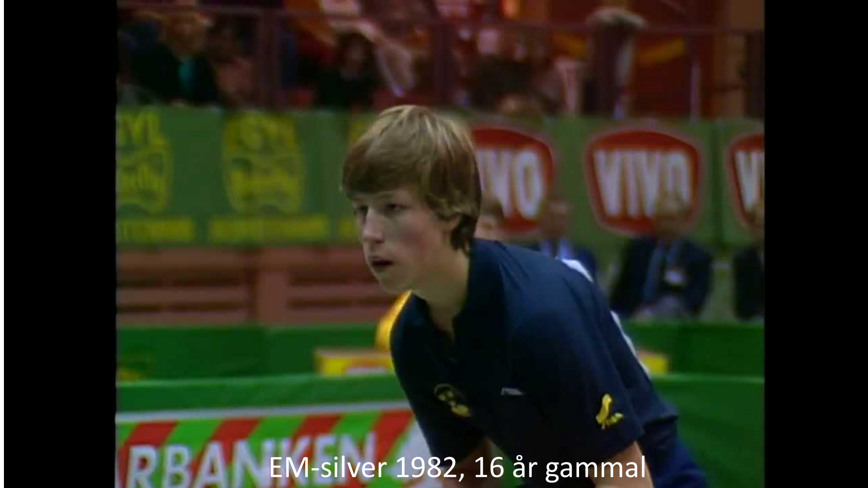
EM-silver 1982, 16 år gammal

http://www.oppetarkiv.se/video/1491731/bordtennis-em-i-budapest-1982-singelfinal