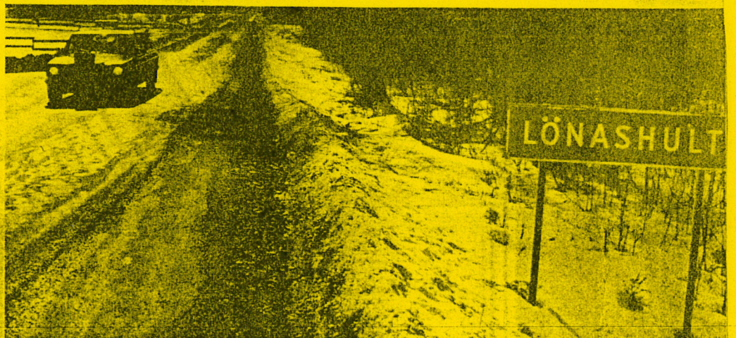
I Lönashult vill socialdemokraterna att den skall byggas.

Att Lönashult blir platsen har socialdemokraterna nu skrivit in i det handlingsprogram som de går till val på. Socialdemokraterna är hittills det enda politiska parti som slagit fast att det blir Lönashult som kommer