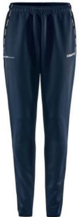
CRAFT SQUAD 2.0 PANTS H: 1912737 | D: 1912738 JR: 1912739 | Färg: 390000 Inkl. Profilhörnan tryck. Senior: 360:- / Junior: 320:-