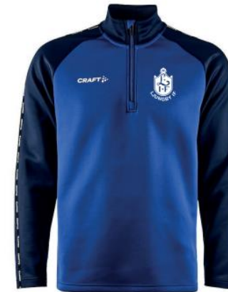
CRAFT SQUAD 2.0 HALF ZIP H: 1912731 | D: 1912732 JR: 1912733 | Färg: 346390 Inkl. LIF emblem och Profilhörnan ryggtryck. Senior: 360:- / Junior: 320:-