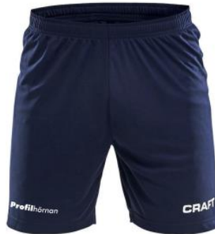
CRAFT SQUAD SOLID SHORTS H: 1905572 | D: 1905576 JR: 1905586 | Färg: 1390

PAKETPRIS (T-shirt, shorts och strumpa). Inkl. LIF emblem och Profilhörnan ryggtryck. Senior: 450:- / Junior: 410:-