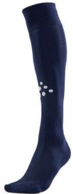
CRAFT SQUAD SOLID SOCK 1905580-1390