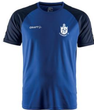
CRAFT SQUAD 2.0 JERSEY H: 1912725 | D: 1912726 JR: 1912727 | Färg: 346390