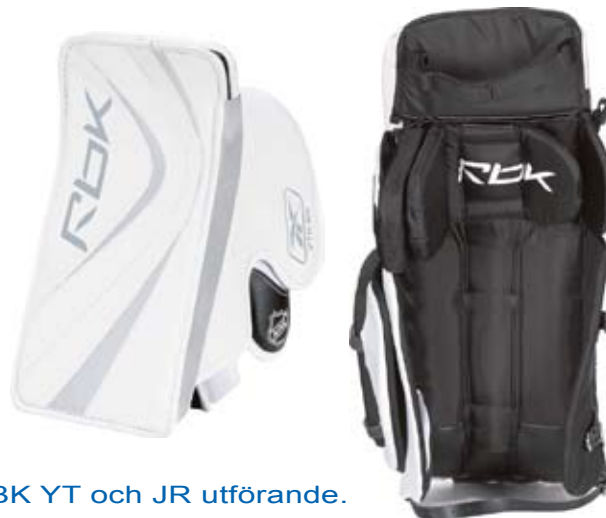
RBK YT och JR utförande.