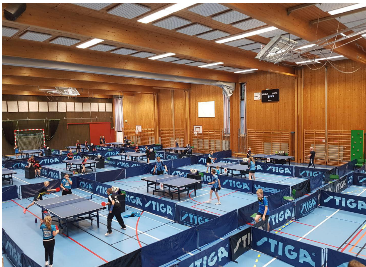
Bilden : Full fart i Lessebo Sporthall där vi arrangerade DM 17-18:e november

17-18:e DM i Småland. Vår lilla klubb fick för andra gången på tre år arrangera Smålands DM och det gjordes som vanligt med bravur. Stort tack till alla som hjälpte till att få detta arrangemang att bli så bra som det blev! Resultaten redovisas på nästa sida.