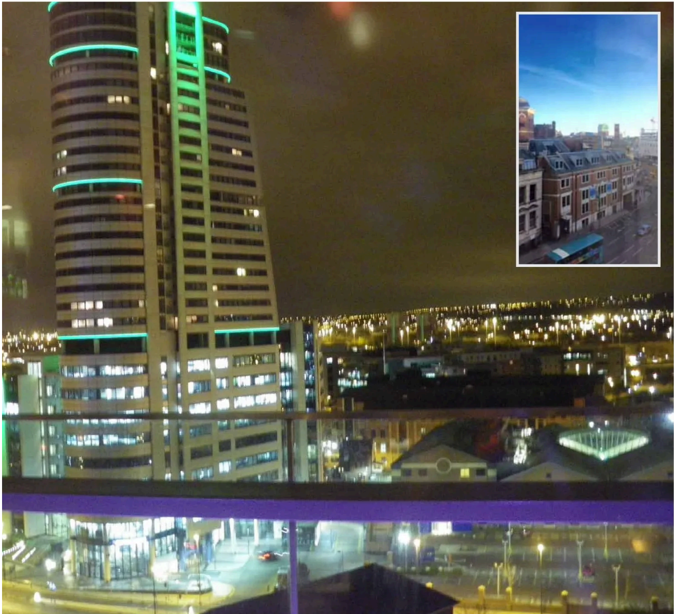
välbekant landmärke och också en gigantiskt stor arbetsplats. Leeds city market är både en inomhus- och utomhusmarknad. Här finns det mesta att köpa, från färska grönsaker, kött och fisk till