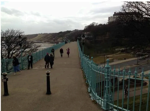
Scarborough vid kusten erbjuder såväl stränder, hisnande vyer och historik.