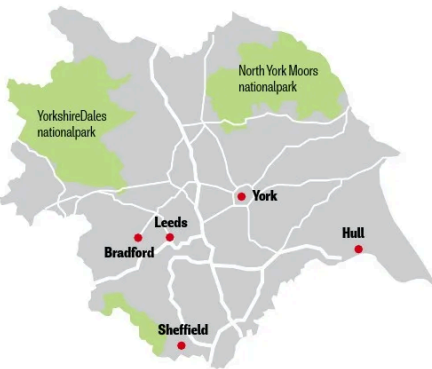
Englands största grevskap sträcker sig från Nordsjökusten i öster fram till Lancashire och Greater Manchester i väster. I norr gränsar det mot Teeside och i söder mot Derbyshire och Lincolnshire.