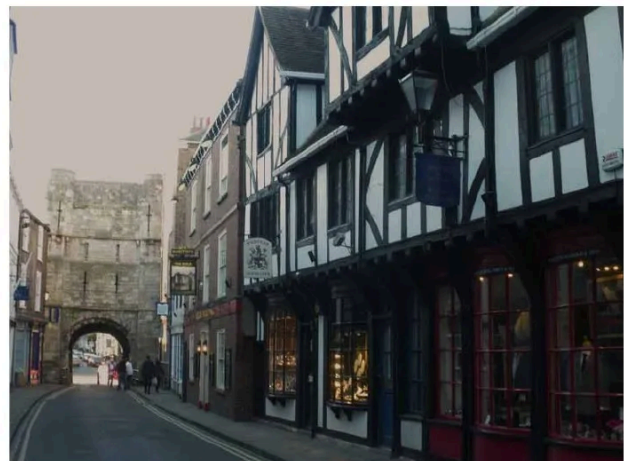
Att vandra runt i gemytliga York är som att gå i ett stort museum.