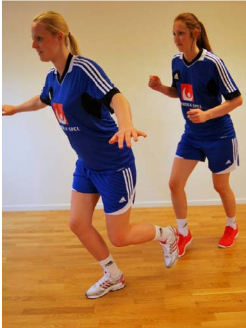
41.3 Utfallshopp med jogg. 3x10/ben