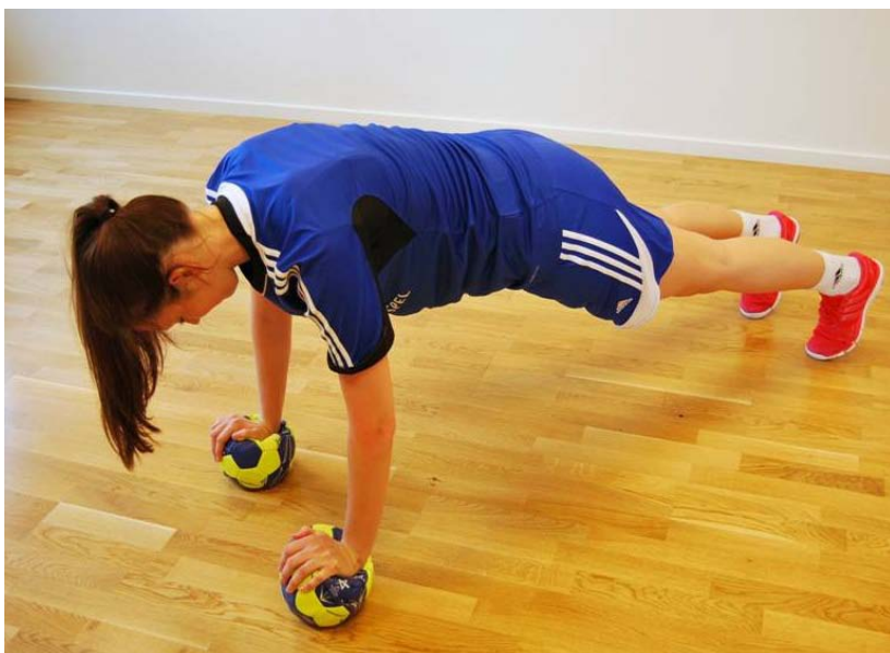
42.4 Armhävning på 2 handbollar. Vanliga armhävningar fast de utförs på boll. Att tänka på är att kroppen skall hållas som i plankläge. 3x10