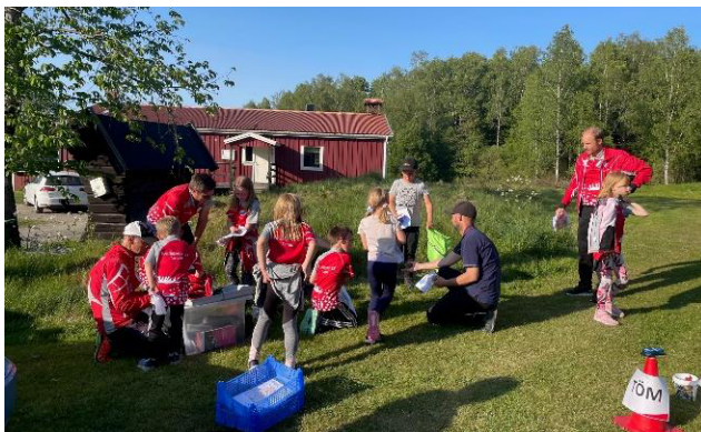
Träning på Ranebo

Vi har haft 40 bokförda aktiviteter, tävlingar ej inräknat, under 2023. Några deltagare från tidigare år har lämnat oss medan flera nya har tillkommit. Många har varit riktigt flitiga och varit med på flertalet av de aktiviteter vi ordnat. 20 vuxna och 18 ungdomar har varit med 10 gånger eller mera. Sammantaget har det varit 59 vuxna och 29 ungdomar med på träningar och andra aktiviteter.