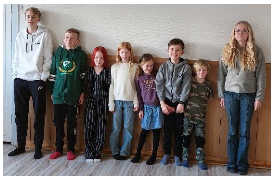
Några av ungdomarna på plats på säsongsavslutningen