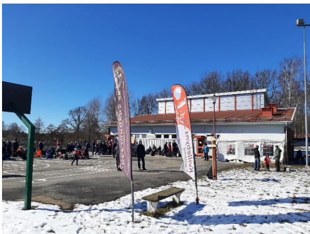
Här en bild från Strömstadsmedeln's arena vid Hedeskolan.

Tävlingarna genomfördes utan några större problem.