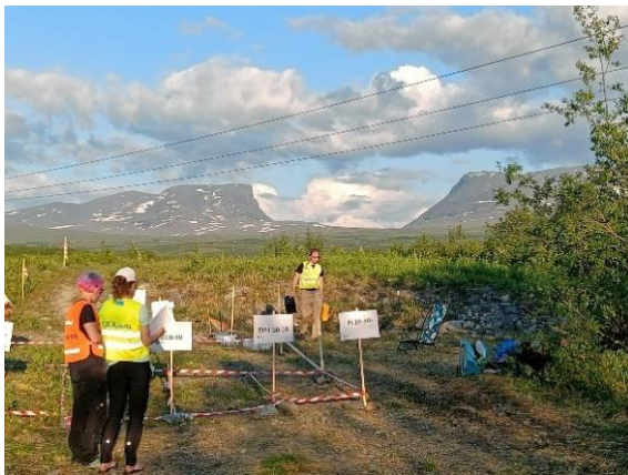
Startplats för orientering i Abisko med Lapporten i bakgrunden.

Tävlingarna vid Abisko gick på fjällslutningen upp mot Lapporten, det var ganska lättsprunget men dålig sikt pga. alla fjällbjörkar. Det gällde att komma nära kontrollpunkterna, man kunde lätt springa förbi punkthöjder och stenar som skymdes av björkarna. Det var inte heller lätt att läsa in sig om man kom fel, vilket jag råkade göra men det blev i alla fall godkända resultat på samtliga etapper. Även om tävlingarna startade sent på kvällen behövde man inte vara rädd för att det skulle bli mörkt, solen lyste ju dygnet runt.