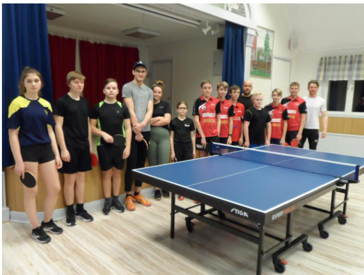
Ungdomsgruppen samlad för träning

Övriga tävlingar som var planerade under mars/april blev inställda och så blev också vårt klubbmästerskap som vi brukar spela i början av april.