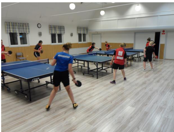
Full fart på träningen.