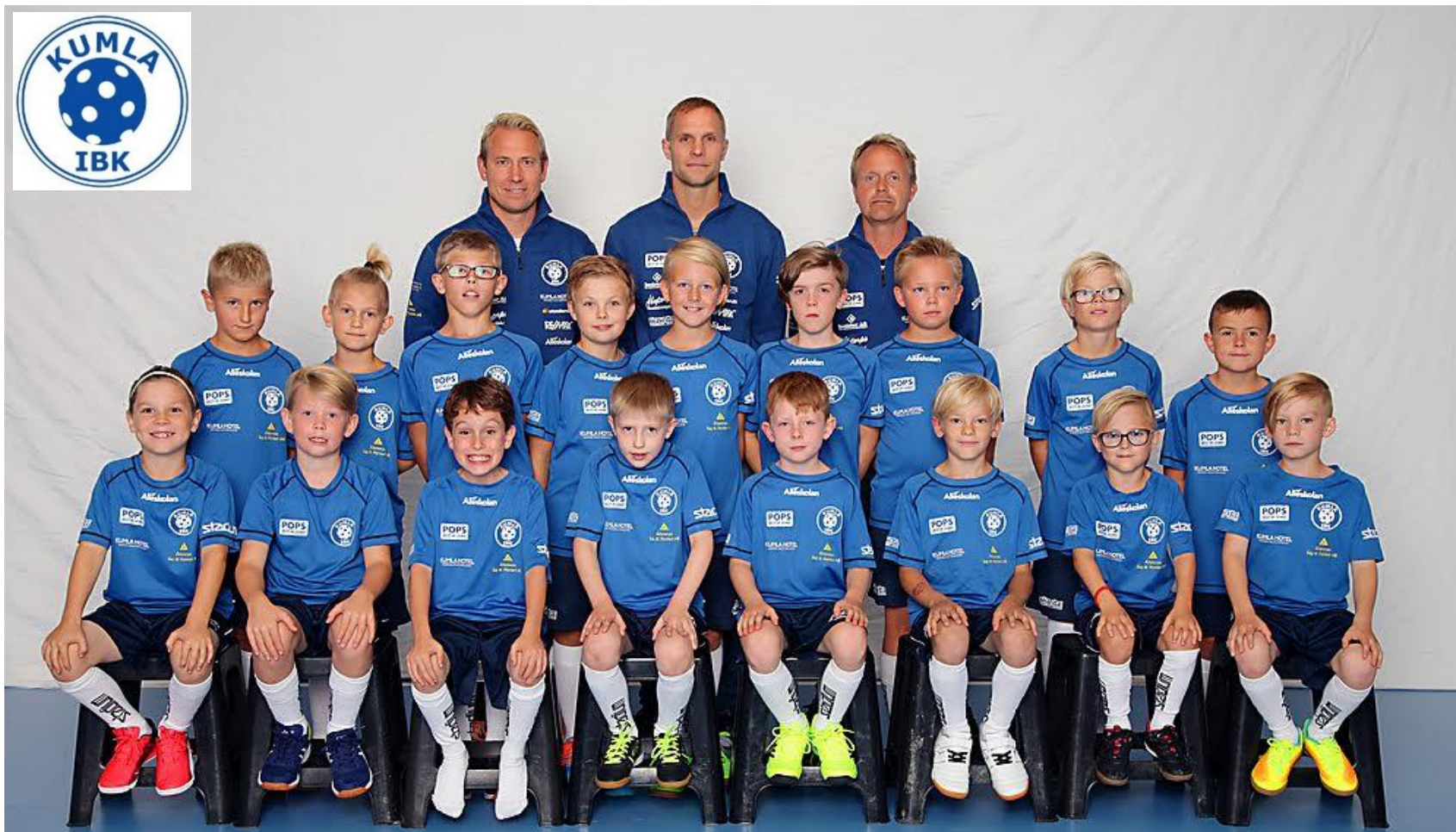
Kumla IBK Pojkar 08-09