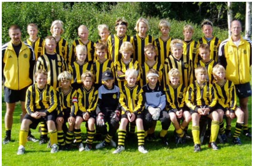
Kubikenborgs IF P93 - 2003