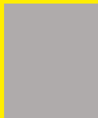
Fredrik Söderlund Tränare