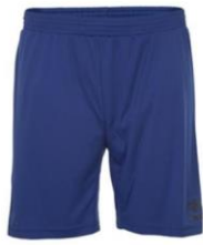
Core Shorts Klubbpris 139:-