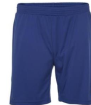
Core Shorts Klubbpris 139:-