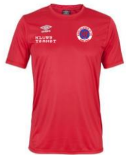
Core Poly Tee Klubbpris 159:- ink logga