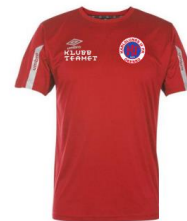
Core SS Jsy Klubbpris ink siffr 229:-