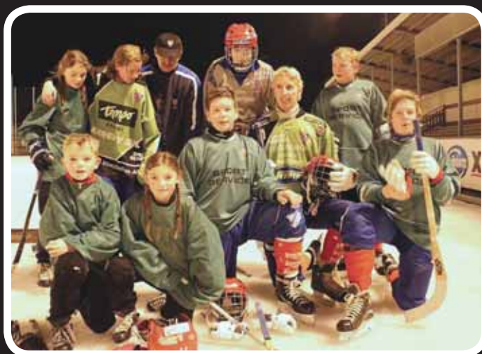
Klubbmästare 2012 - Lag Bollnäs

Bollnäs - Broberg 1 - 1 (Bollnäs vann på straffar).