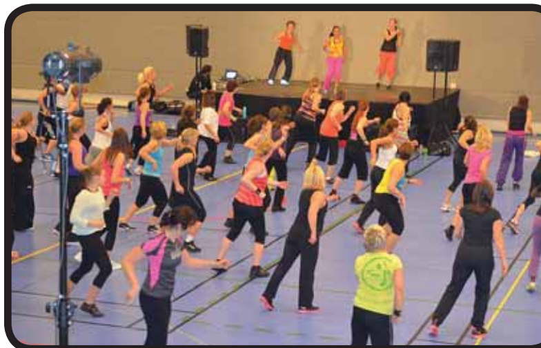
Mimershallen. Den 4 februari svängde det ordentligt i sporthallen i Kungälv. Tack alla som bidrog till att vi kunde skänka 3.500 kr till Barncancerfonden.