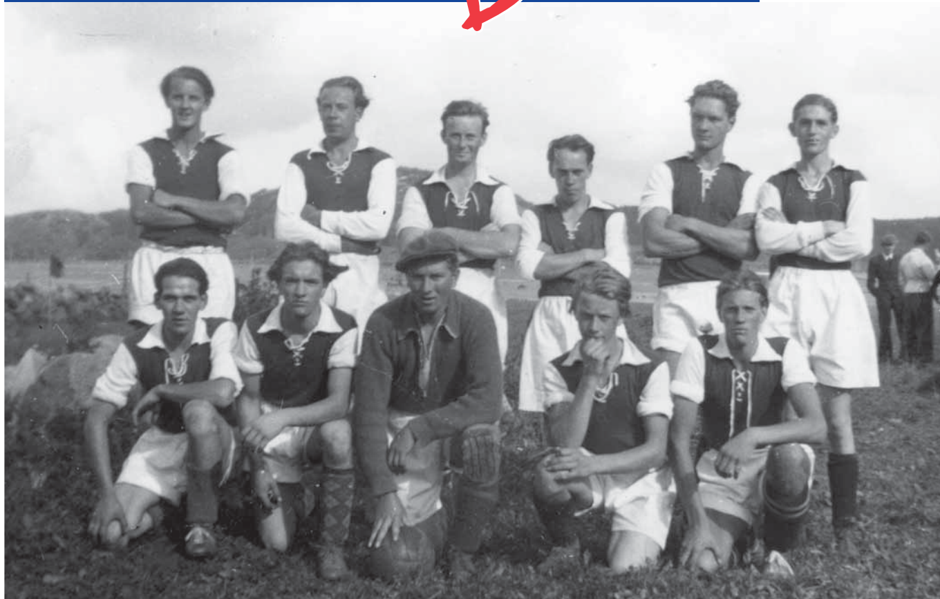
1945 Kareby fotbollslag i sina nya Arsenalinspirerade lagtröjor.