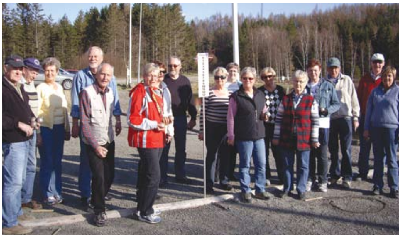
Utomhuspremiär för boulegänget vid Kringledammen.

Fler lagbilder hittar du på sidorna 13-16 och längst bak i klubbladet.