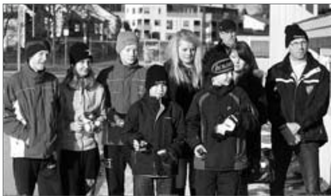
Delar av segrande Sirius efter prisutdelningen

Kvällen avslutades med en grandios final mellan Sirius och Motala. Vid full tid stod det 1-1 och efter förlängning på 3 minuter så petade Sirius in 2-1, efter detta jagade Motala förgäves en kvittering men lyckades inte. Detta gjorde att KIS Mästare 2008 blev Sirius.