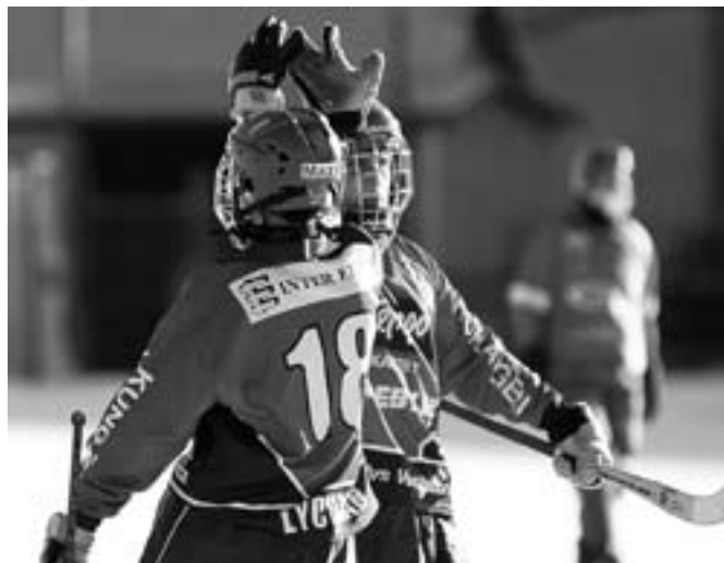
High five efter ett av Kareby IS 144 mål i vinter

Resten av serien blev en lång defilerings även om matchen mot Vargön borta var en jämn fight och en