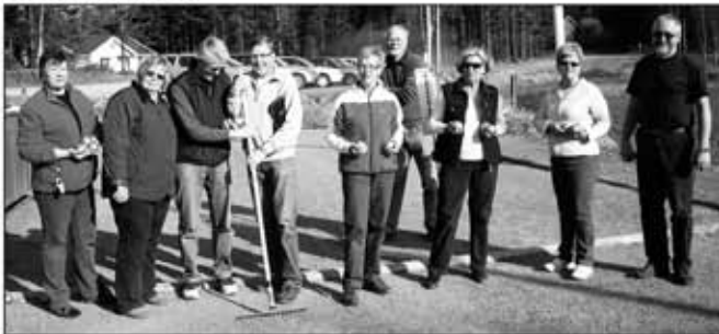
Glatt boulegång vid Kringledammen