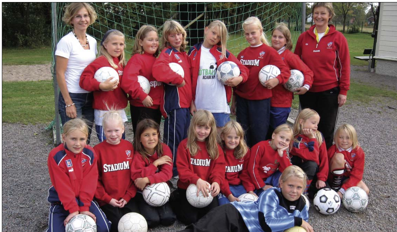
Fotboll F-98 och 99