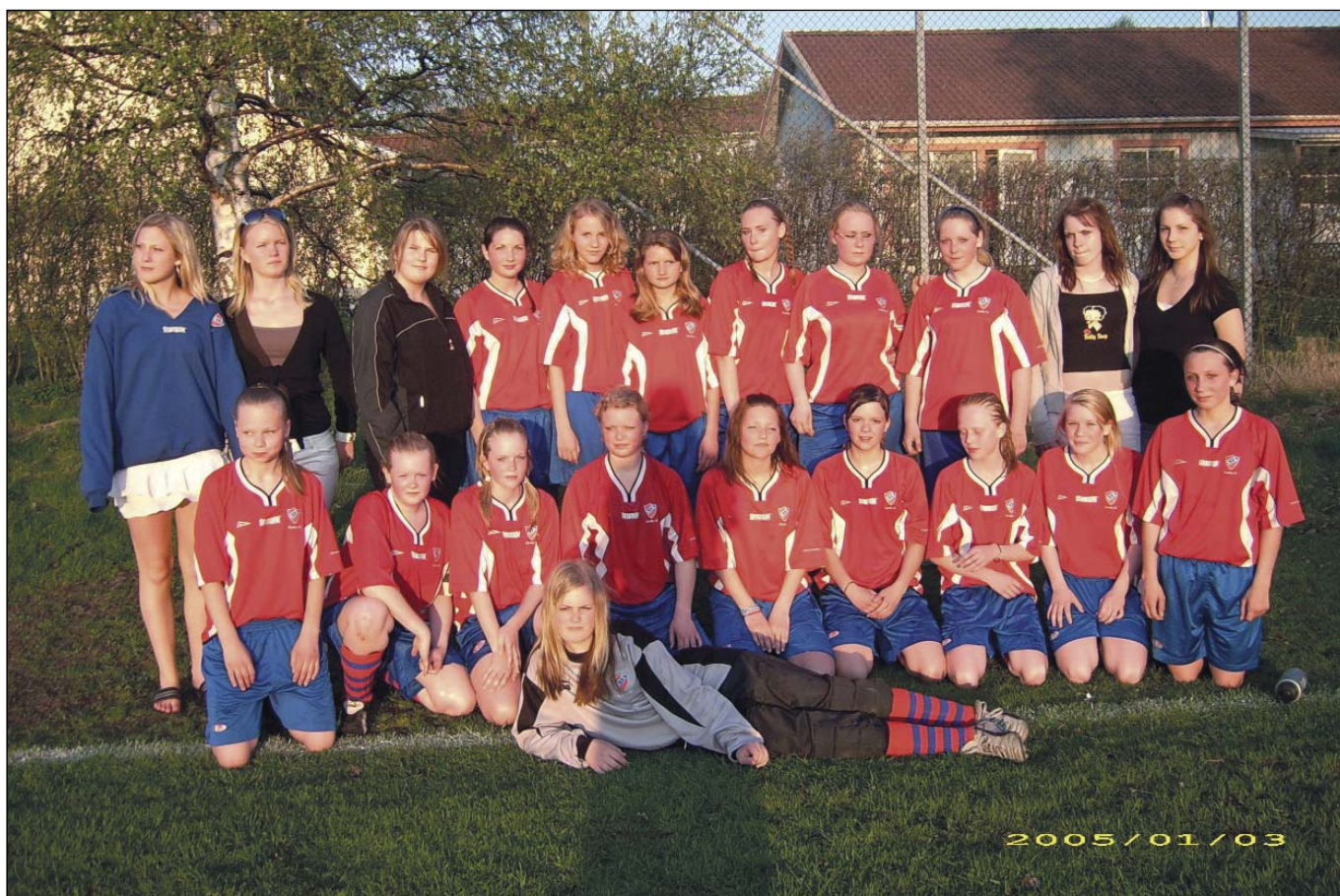
Fotboll F-91 och -92