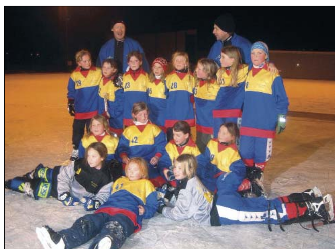
Bandy F-11 (fr. sid 8). Denna bild missades vid pressläggningen av vårens klubbblad. (Red anm)