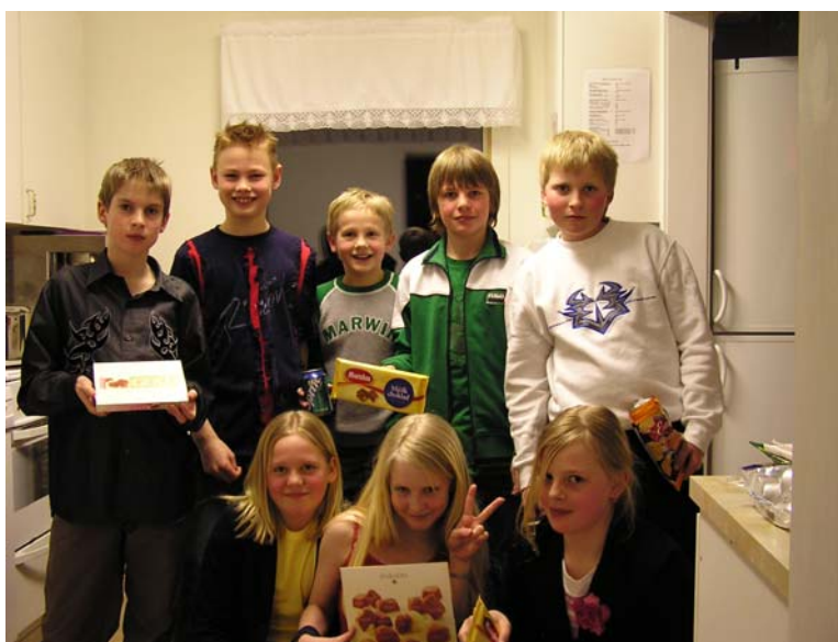
Lyckliga deltagare (och vinnare) i karaketävlingen lördag.