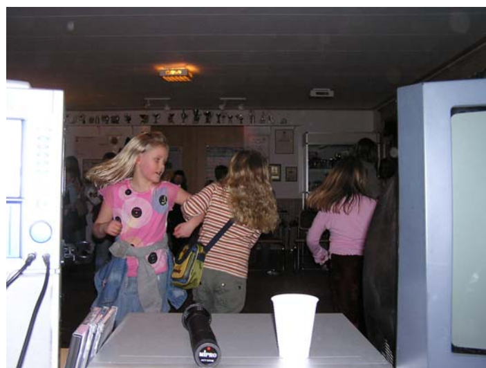
Livat på dansgolvet fredag kväll