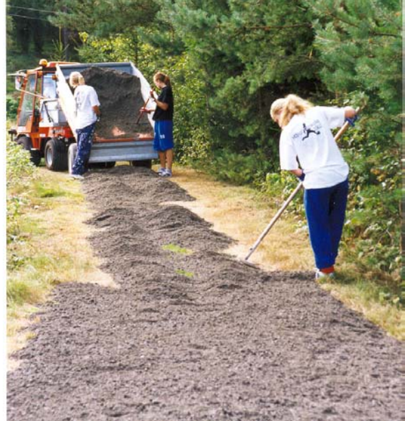
Damlaget fixar löparslingan