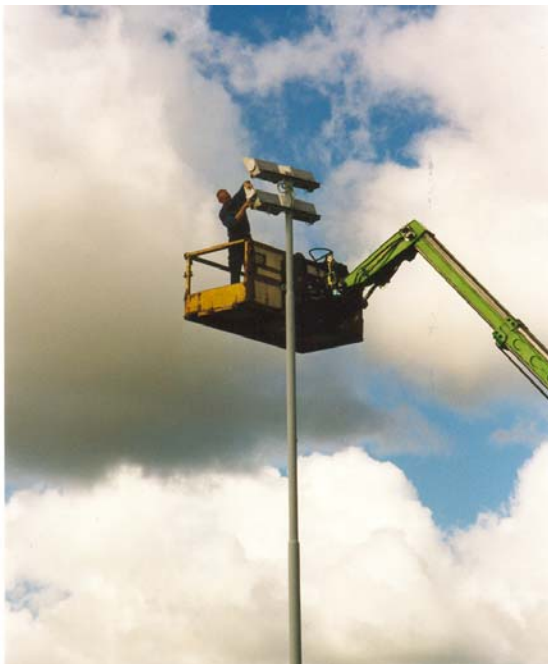
Lennart byter lampor