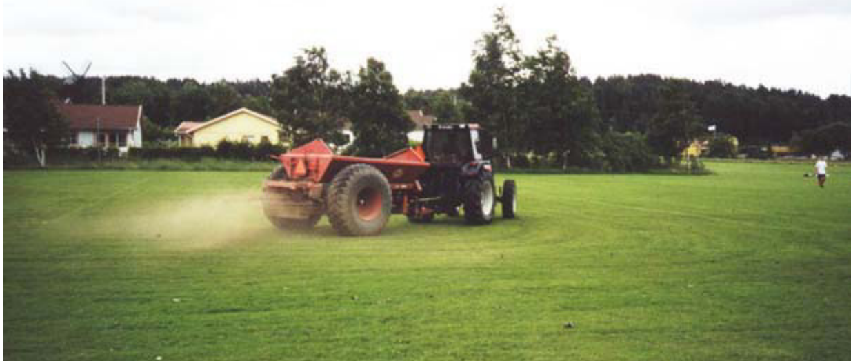
Dressning av fotbollsplan 35 ton sand spriddes ut . Tack till medhjälpare och maskinutlånare