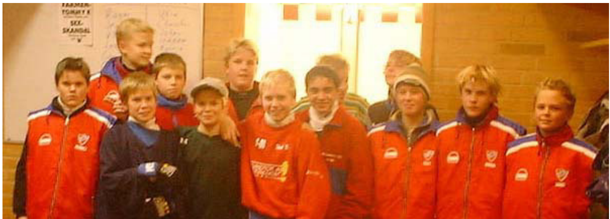
Bandy P 89