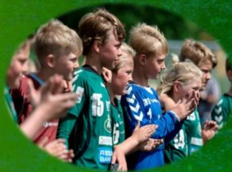
Glädje och Gemenskap