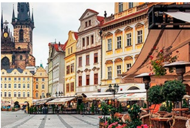
Vacker arkitektur på torget i Staré Mesto/Gamla Stan

STARÉ MESTO | Gamla Stan i Prag bör besökas vid ett tillfälle varje gång man befinner i Prag. Minst. Här finns gott om mysiga restauranger, barer, shopping och underhållning. Om somrarna fylls stan av glasstörstande turister och i december byts glassen ut mot mysiga julmarknader som doftar av glögg och kryddnejlikor.