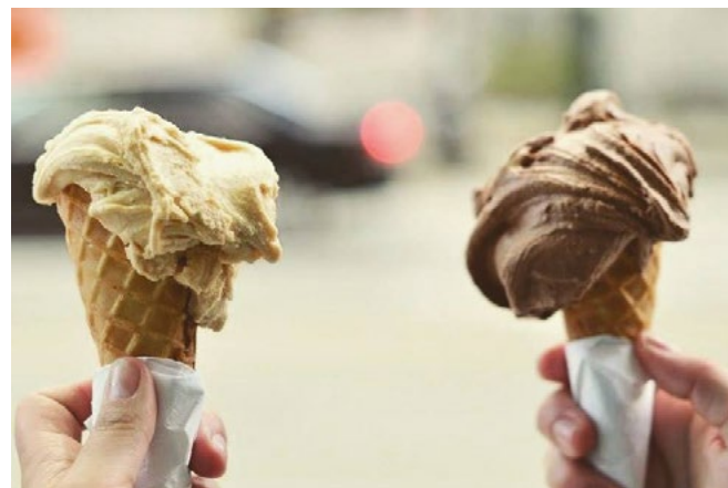
Prags bästa glass hittar ni på Crème de la Crème

CRÈME DE LA CRÈME | Somrarna i Prag kan bli varma och alla vet att ingenting går upp mot en glass i värmen. Om ni strosar längs populära Karlova Street behöver ni göra ett stopp för Prags kanske bästa glass. På menyn finns både laktosfria och veganska alternativ. Adress: Husova 231/12