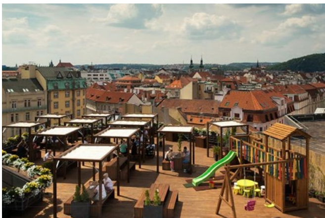
Ölträdgård och lekplats med utsikt över Gamla Stan på T-Anker

T-ANKER | Ta hissen upp till denna ölträdgård och avnjut mat och dryck bland Gamla Stans takåsar. För den som är nyfiken på mikrobryggd öl finns här tio olika kranar som ständigt byts ut. Om ni reser med barn så finns här en lekplats och pysselhörna för de rastlösa. Adress: Náměstí Republiky 656/8