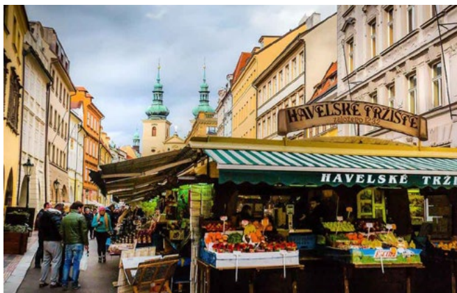
Färsk frukt och souvenirer på utomhusmarknaden Havelske Trziste

HAVELSKÉ TRZISTE | I centrala Prag ligger denna utomhusmarknad som har funnits i närmare 1 000 år. Här kan ni hitta allt från roliga souvenirer till färsk frukt och grönsaker. Väl värt att strosa igenom om man har vägarna förbi. Adress: Havelská 13