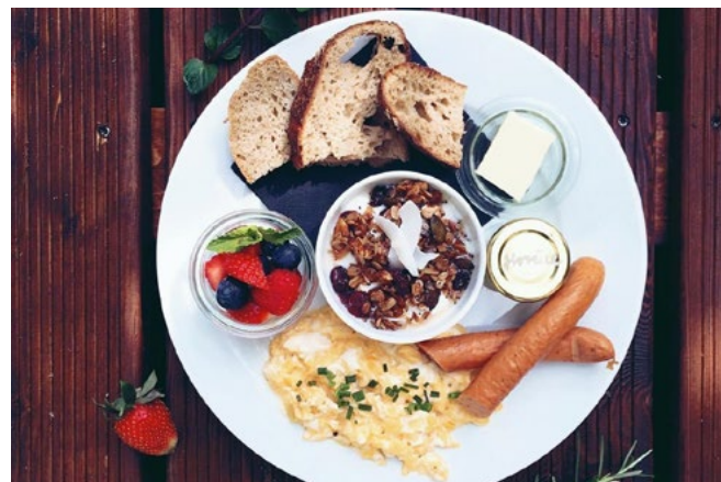
Frukost på Café Jen.

CAFÉ JEN. | Frukost utanför hotellet? Café Jen drivs av ett gäng driftiga kvinnor som har specialiserat sig på frukost, hantverkskaffe, tårter och sötsaker till fikat. Caféeet ligger sydost om Prags stadskärna i Vršovice och är väl värt ett besök under resan. Eller två. Adress: Kodaňská 37