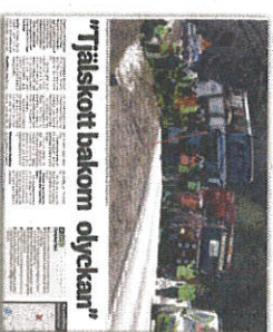
BT 4 april.

minnet under resan var meddelandet hemifrån, från pappan till Wilmer, som blev svårast skadad av Kinnakillarna i bussolyckan. Han fick amputera en arm och kunde därför inte åka med.