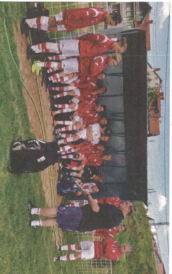
Genomgång under en av träningsarna i Kosovo. Killarna i Kinna P 02-03-lag kom tillbaka med många minnen.

– Efter olyckan tränade vi mer än vanligt, det var skönt. Sedan hade vi resan