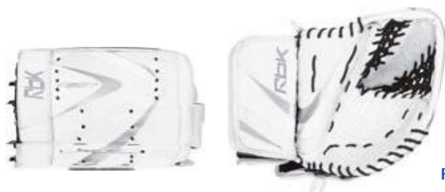
RBK YT och JR utförande.

Svenska Ishockey-förbundet har under några års tid genomfört utbildningar i val av utrustning till ett överkomligt pris utan att ge avkall på säkerheten. För att hitta rätt utrustning har en affisch producerats som också fungerar som kroppslängdmätare. Skalan är 1:1 med 10-centimeters steg. Affischen visar lämplig utrustning för utespelare och för målvakter.