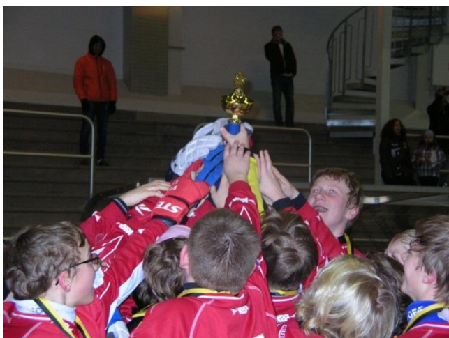
Figur 2. Segerpokalen i Slättbergscupen, Trollhättan, 2012

Jönköping BK, 2. Mjøndalen Lillegutt, Norge, 3. Blåsut BK, Vänersborg, 4. Gripen Bandy Trollhättan, 5. IFK Kungälv, 6. Ale-Surte BK