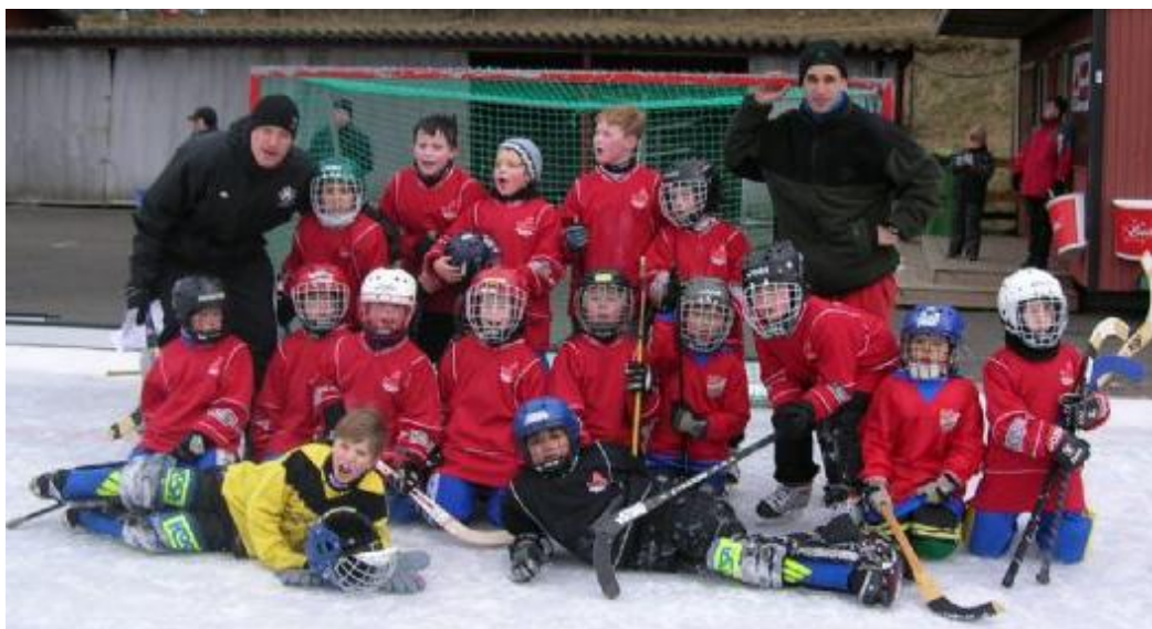
Figur 1. Delar av truppen P99 säsongen 2007/08 efter match på Råslätts IP.

Träningsuppslutningen bedöms som mycket god med tanke på de dåliga klimatförutsättningar som rått under vintern (plusgrader, regn, vatten på isen mm). Laget har utvecklats mycket under säsongen och utgör en härlig kader av barn spridda över stort område och som inte känner varandra från skola etc. men som finner gemenskap på isen.