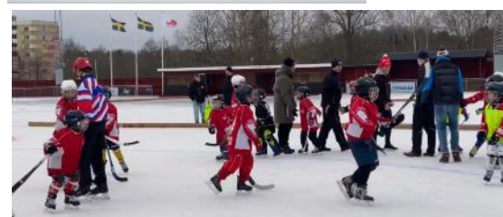
Figur 5. TV: Jönköping Bandy IF hemsida hade säsongen 2019-20 över 52 000 besök. TH: Facebook-inlägg med årets näst mest nådda personer (3 900 st) var skridsko-och bandyskolecup.

Besöksfrekvensen under året (maj-april) på föreningens sidor var 52 067 besökare som tittade på 120 383 sidor. Det toppade under perioden november till mars med närmare 17 000 sidvisningar per månad! Det var en ca 25% ökning mot säsongen innan.