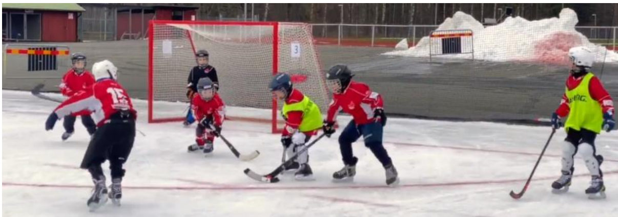
Figur 14. Bandykolan cup med totalt nio lag från sex föreningar.

Som vanligt – eller för åttonde gången - avslutade verksamheten med vår populära Bandykolan Cup. Lag som deltog i årets cup var följande: IFK Motala 2 lag, Nässjö IF 2 lag, Vetlanda BK 2 lag, Tranås BOIS, Borås bandy och JB. Respons var god för deltagande lag: ”-Tusen tack Jönköping för en fantastisk bandydag! Grymt bra upplägg! Vi har idel glada miner på alla våra spelare, Tack till alla deltagande lag.”