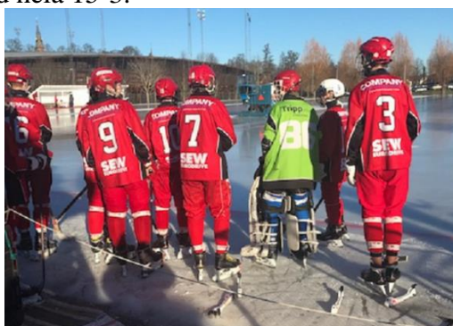
Figur 10. Ivrig väntan på att beträda isen.

Match 2 innebar ny bortamatch, nu mot VBK svart. En match som svängde flera gånger och VBK kvitterar till 7-7 på matchens sista hörnskott. Surt. Hemmapremiären mot Tranås blev målkalas och storseger med hela 15-3.