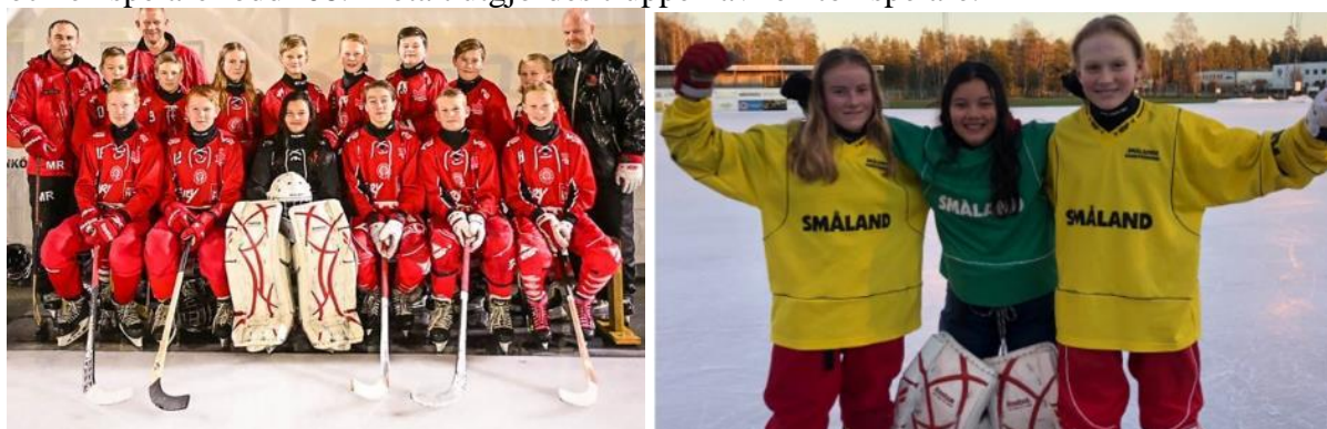
Figur 13. Jönköping Bandy U14. I truppen ingår tre tjejer som alla var med i Smålandslaget under vintern.

Laget började säsongen i Kinnarps Arena där vi höll till i september och oktober innan vi fick gå på isen på Råslätt. Laget bestod av fem spelare födda-06, nio födda -07 (varav tre tjejer) och en spelare född -08. Totalt utgjordes truppen av femton spelare.