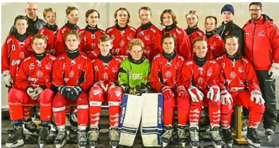
Figur 12. JB U16

I seriespelet så har målnittet framåt varit nästan 8 mål per match. Det blev 94 mål framåt, flest i serien, och det har varit bra spridning på målskyttet. Bakåt så hamnade vi på andra plats med 49 mål insläppta (ca 4 i snitt). Både när det gäller hörnor och straffar hamnar vi i toppen. 10% av våra hörnor går i mål, vilket är bra, högst snitt. 5 av 6 straffar har det blivit mål på, näst bäst. När det gäller utvisningar så hamnade vi på 200 min, i mitten när man ser Fair play tabellen.