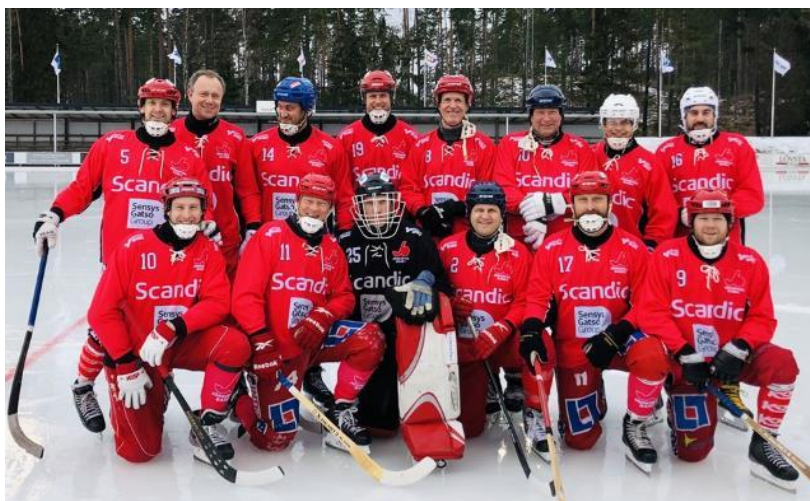
Figur 9. JB veteraner som knep en silverplats i DM 2020.