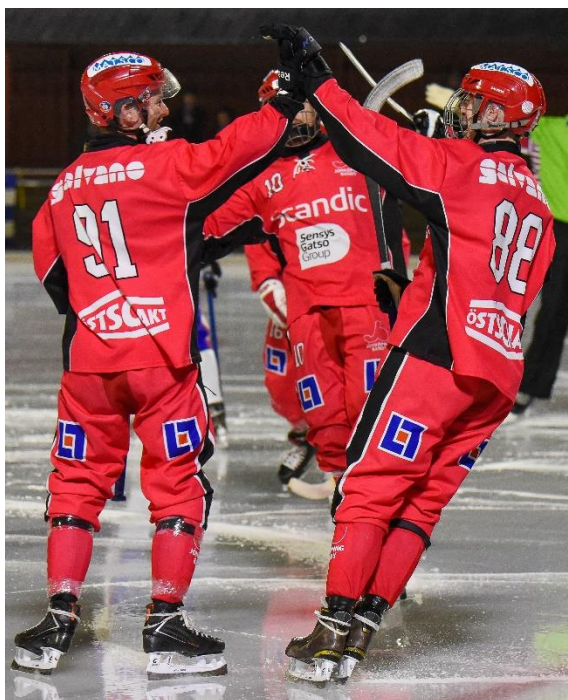
Figur 8- TV: Seriematcher under säsongen. TH: Samtliga hemmamatcher har dokumenterats av Peax JBLID på ett förträffligt vis.

JB gör alltså det smått fantastiska och vinner samtliga matcher. I kvalet ställs man mot Surte BK (som man besegrat i en träningsmatch) samt mot UNIK från Uppsala. Starka i hågen gav laget sig iväg till Ale Arena för möte Surte. Och det var ett bombardemang mot Surtemålet men som i röda ögon slutade orättvist med förlust. Surte kontrar/gör mål på få försök och vinner med 5-4. JB tar dock revansch hemma och återställer ordningen, från haft en tydlig ledning till onödigt svettigt i slutet, vinst 4-3. Mot Unik ledde JB länge och hade matchen i sin hand men förlorar snopet med 4-5, liksom på bortamötet där UNIK visade klass och vann med 8-4. Det räckte dock då UNIK krossade Surte sista matchen och JB blev två i gruppen och därmed den sista allsvenska platsen.