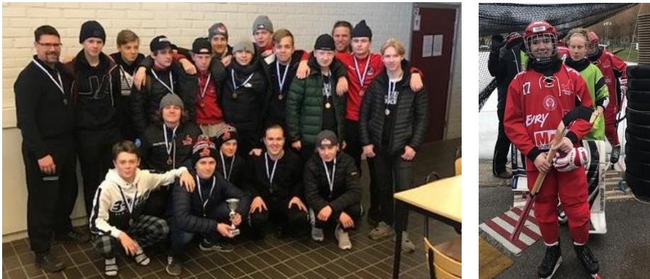
Figur 11. Det blev en tredjeplats i Åtvidabergscupen efter strålande spel mot bra motstånd!

I sista gruppmatchen på lördagskvällen var det storpublik då vi mötte hemmalaget Derby/Åtvidaberg. Med en del marginaler och kanske inte helt rättvist så blev det seger med 2-1. Tidig söndagsmorgon och kvartsfinal mot Hammarby. Stundtals spelar vi fantastiskt bra bandy och kan efter stor dramatik vinna med 5-4 och klara för semi.