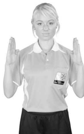
915 Felaktigt avstånd (underarmarna lodrätt)