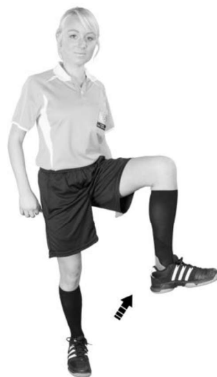
913 Hög spark (foten i knähöjd, vriden utåt)