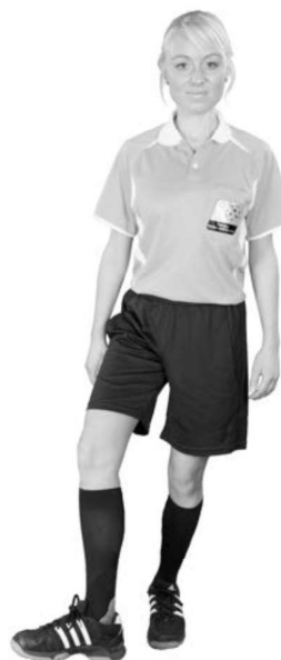
912 Otillåten spark (foten i vristhöjd, vriden utåt)