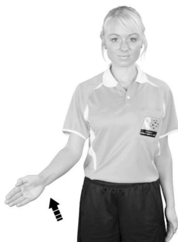
920 Hands (handflatan snett uppåt)