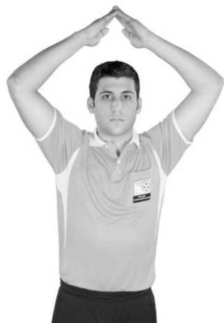
914 Beträdande av målvaktsområde