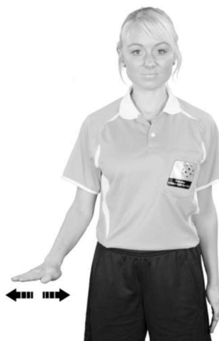
919 Liggande spel (handflatan nedåt)