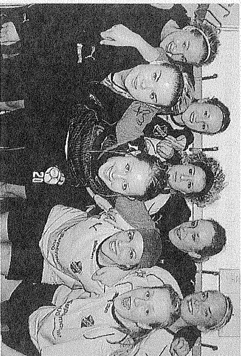
Norra Fågelås A gick till semifinal, men där tog det stopp mot TGIF/IFK som till slut vann hela turneringen.