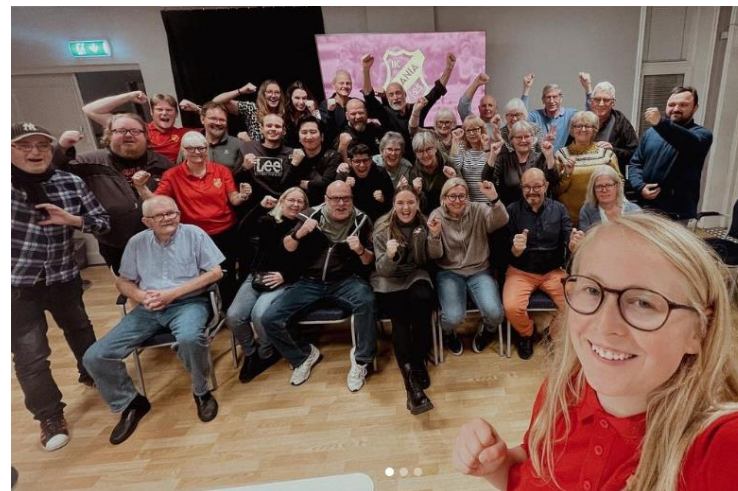
Extra årsmöte, 2022

på fyllnadsval av en ledamot samt val av tre personer i valberedningskommittén.