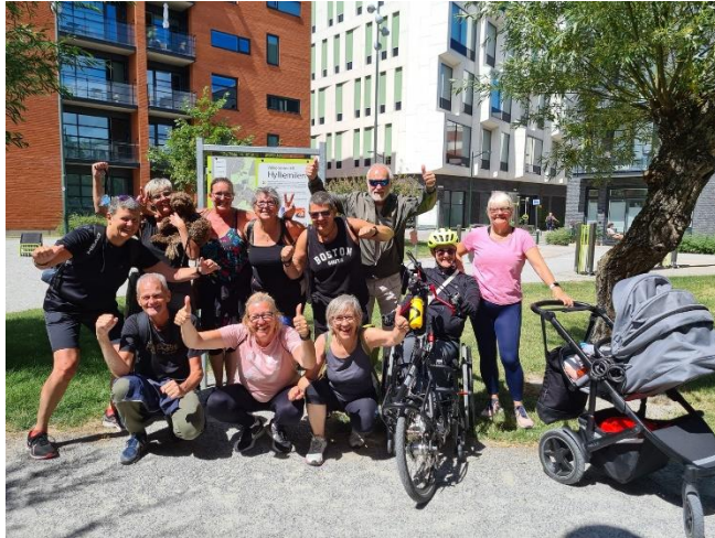
I mål efter 5:e och sista rundan av Malmö Five

Runt 10–14 medlemmar deltog i varje runda – och konceptet var uppskattat av medlemmarna som bidrog med glädje under alla 5 rundor.