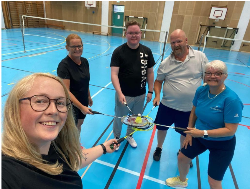
Foton: Bland de första träningstillfällena. Nu är det i genomsnitt 8–10 spelare vid varje träning.

Avslutningsvis vill vi säga tusen tack till alla spelare som deltagit i verksamheten och bidragit med härlig spelglädje och idrottslig utveckling. Tack!