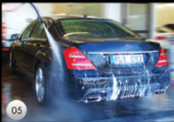
05 Bilen avspolas med högtryck noggrant.