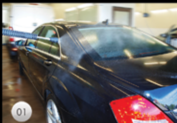
01 Avfettning är själva starten. Det mest grundläggande steget mot en ren bil.