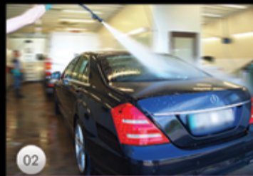
02 Bilen högtrycksspolas för hand runt hjulhus, fälgar och nummerplåt för att avlägsna all smuts!