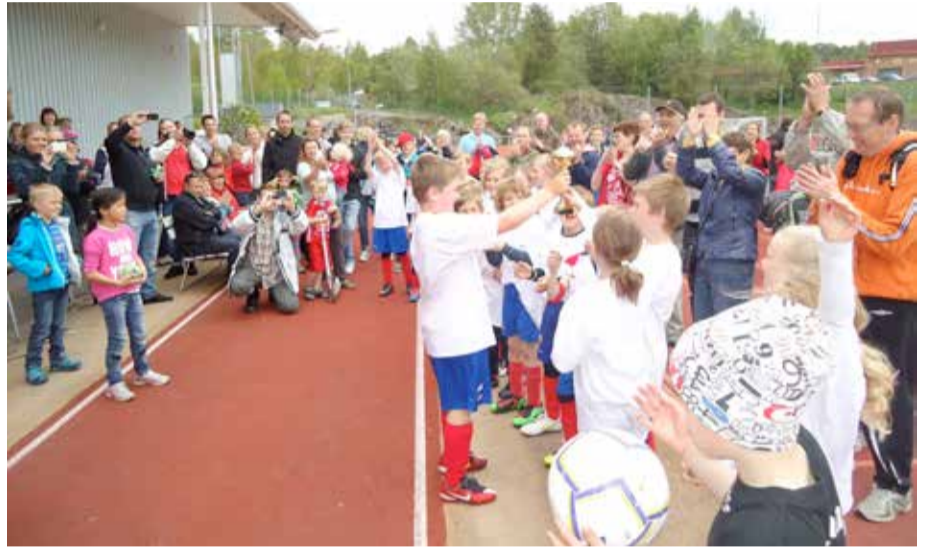
ICA Maxis Vårcup är en av landets största skolcuper. Turneringen har dess rötter från slutet av 60 talet och arrangeras årligen av IK Kongahälla.