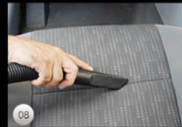
08 En gång i månaden bjuder vi på invändig dammsugning som noggrant utförs av vår duktiga personal.