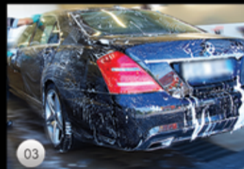
03 Noggran handtvätt av bilen och fälgarna med shampoo.