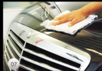
07 Själva torkningen görs med 100% repfri handduk.