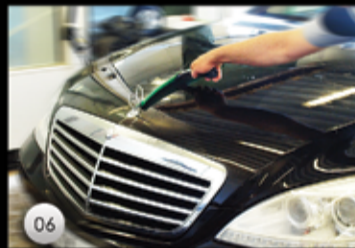
06 Grovtorkning görs med en mjuk och ren gummiskrapa.