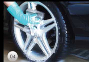
04 Fälgar handtvättas noggrant!