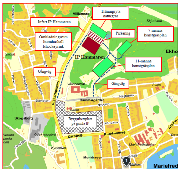
Översiktskarta IP Hammaren i Mariefred